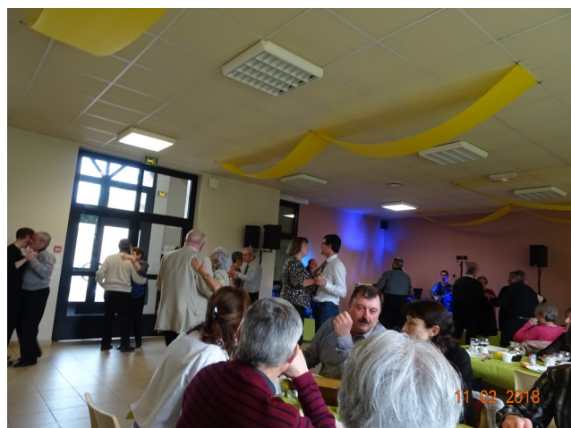
Tête de veau du 11 Février 2018 →