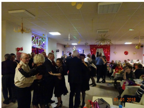
← Réveillon du 31 Décembre 2017

Paiement à la réservation, les chèques seront libellés à l'ordre d' «A DEUX L'ON DANSE»