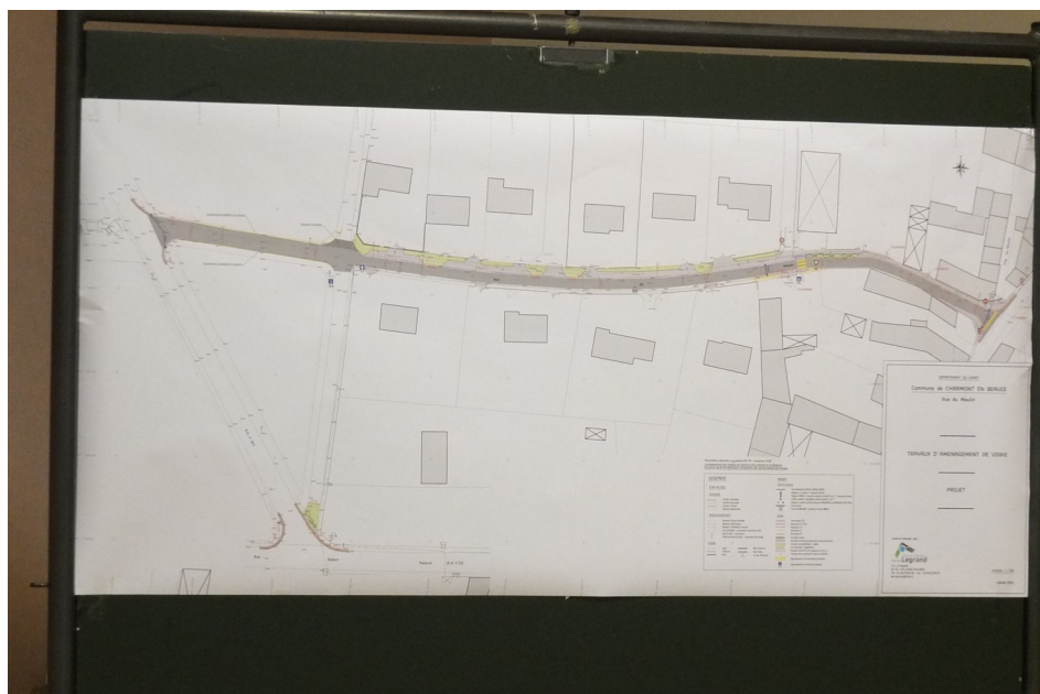
Plan de la future rue du Moulin